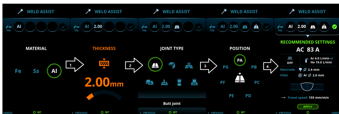
Рис. 1. На рисунке показаны все этапы выбора с помощью Weld Assist. После того, как пользователь ответил на четыре простых вопроса, функция Weld Assist автоматически настраивает четыре наиболее важных параметров сварки, а также выдает ему полезную дополнительную информацию и инструкции.

Правильные параметры сварки подбираются исходя из четырех основных показателей используемого процесса сварки. Аппарат последовательно запрашивает каждый из этих показателей, выводя наглядную информацию на графический пользовательский интерфейс (см. рис.). Первый элемент в главной группе — это основной материал, который будет свариваться. Возможные варианты: сталь (Fe), нержавеющая сталь (Ss) и алюминий (Al). Если аппарат укомплектован блоком питания постоянного тока, то можно выбрать только сталь или нержавеющую сталь. Для сварки стали используются параметры, оптимизированные для конструкционной стали марки S355 (у каждого поставляемого аппарата они будут зависеть от толщины материала), для сварки нержавеющей стали — оптимизированные для марки 316L, а для алюминия — оптимизированные для чистого алюминия. Тем не менее, эти параметры были проверены на разных сплавах, поэтому они являются максимально универсальными.