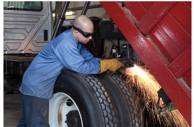
Ajoneuvojen korjaus- ja muunnostyöt