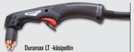
Duramax LT -käsipoltin